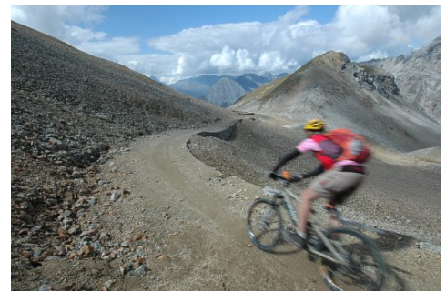
Abfahrt von der Bocchetta di Pedenolo

Per Shuttle bezwingen wir den Umbrail. Anschliessend fahren wir via Bocchetta di Pedenolo hinab zum Lago di Cancano. Die letzte lange Abfahrt kann man nochmals richtig geniessen, bevor wir die Tour entlang der Adda ausklingen lassen.