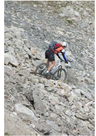
Downhill nach Livigno