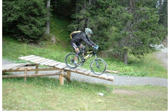
Bike-Parcour der Lenzerheide

Special: wer will, kann mit dem „Hörnli-Speed“ zur Hörnlihütte fahren und die Freeridestrecke benutzen!