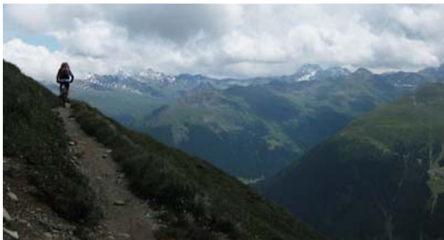
Abfahrt nach dem „Tritt“

Tagesstrecke 40.1 km / 1218 hm uphill / 1392 hm downhill